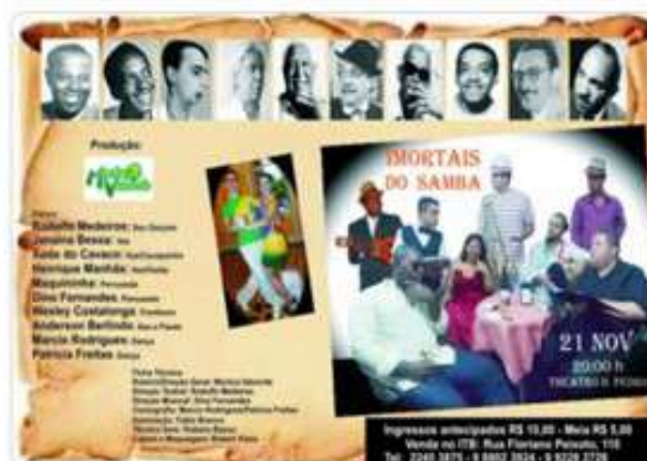
Imortais do Samba