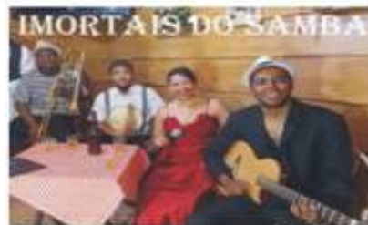
O show vai comemorar o Dia Nacional do Samba

Petrópolis, Região Serrana do Rio, vai comemorar o Dia Nacional do Samba, celebrado nesta segunda-feira (2), com muita música em um show especial com os 'Imortais do Samba'. O espetáculo, com direito à cenário e dança, acontece às 20h na Casa de Cláudio de Souza. A entrada é gratuita.