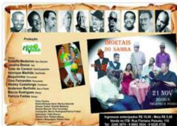
Imortais do Samba