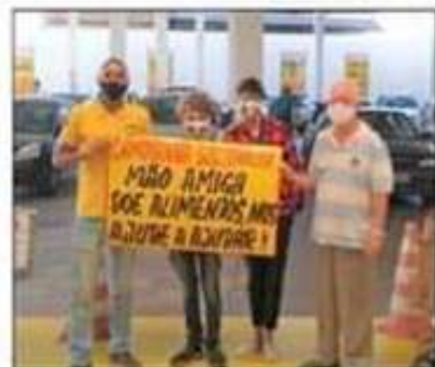
Membros do Lions Club e do Clube dos Castores