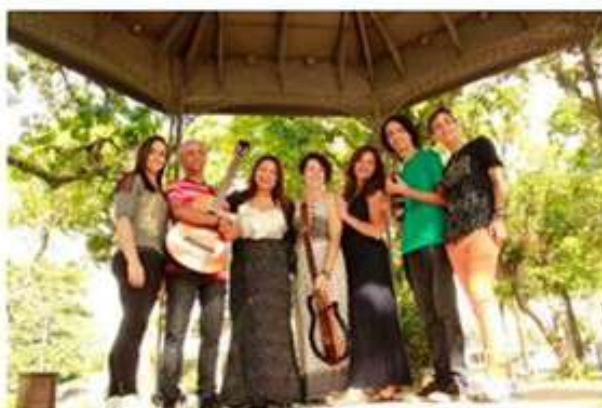
Apresentação do Samba Teu Nome é Mulher neste domingo no Palácio Quitandinha.

Por G1, Petrópolis 12/04/2018 17h46 - atualizado às 17h46