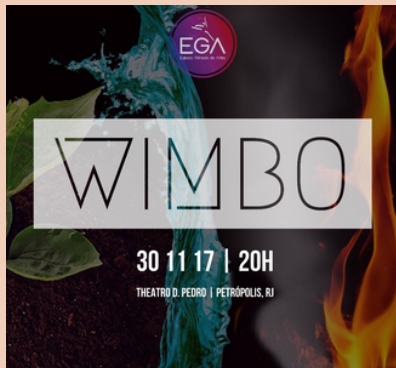
2017 Espectáculo de Dança Wimbo Theatro Dom Pedro