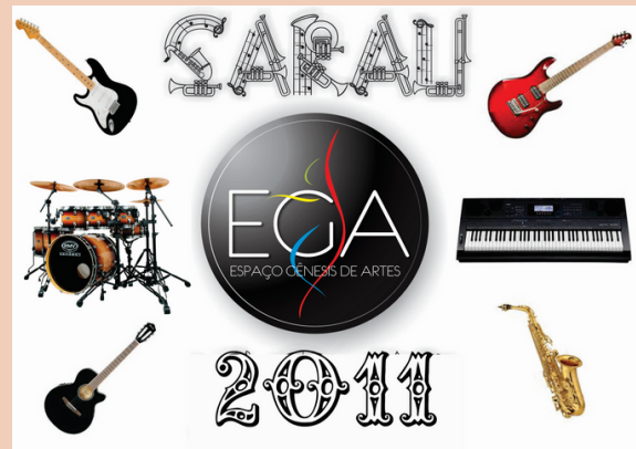
2011 Sarau II Teatro Afonso Arinos