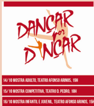
2016 Festival Dançar por Dançar