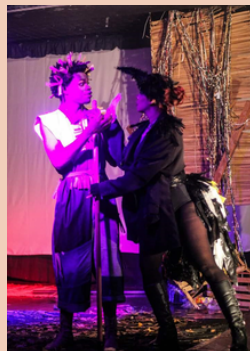
2016 Espetáculo de Teatro O Espantalho e o Lavrador Teatro Afonso Arinos