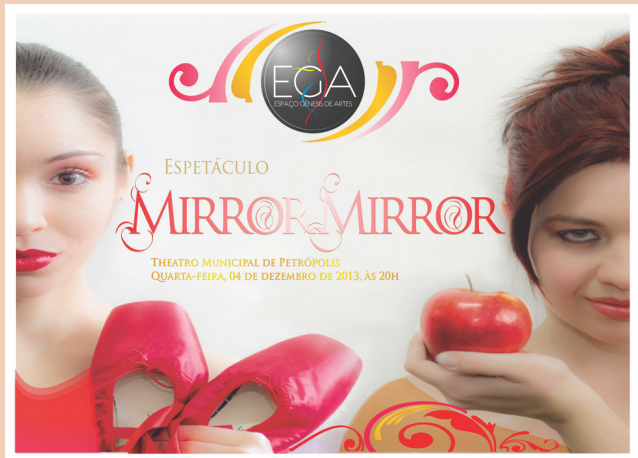
2013 Espetáculo de Dança Mirror Mirror Theatro Dom Pedro