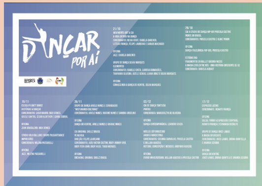
2017 Projeto Dançar por Aí