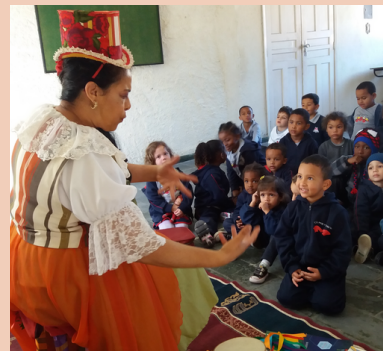
2016 Contação de História Florisbela Comunidade Alto Independência