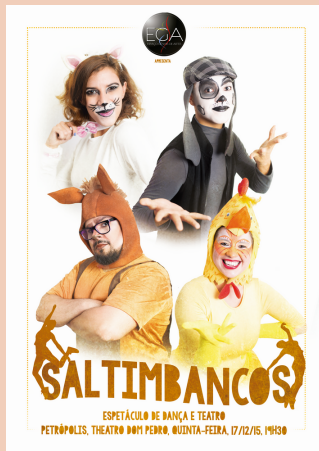
2015 Espetáculo Saltimbancos Theatro Dom Pedro