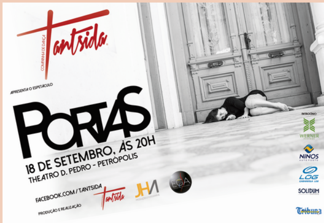
2014 Espetáculo da Cia Tantsida Portas Theatro Dom Pedro