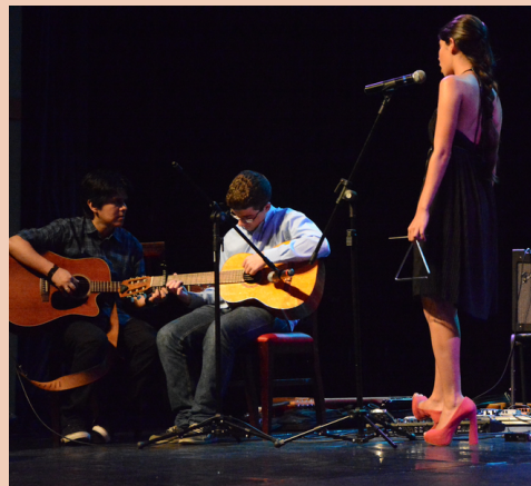
2015 Sarau V Teatro Afonso Arinos