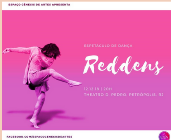
2018 Espetáculo de Dança Reddens Theatro Dom Pedro