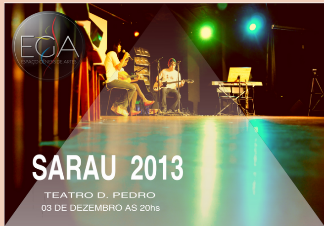
2013 Sarau IV Theatro Dom Pedro