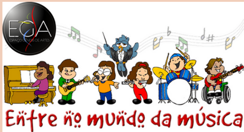
2010 Sarau I Teatro Afonso Arinos