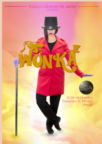
2014 Espetáculo de Dança Wonka Theatro Dom Pedro