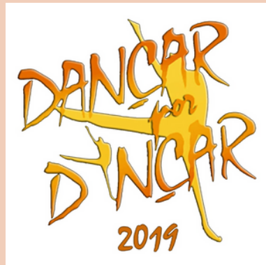
2019 Festival Dançar por Dançar