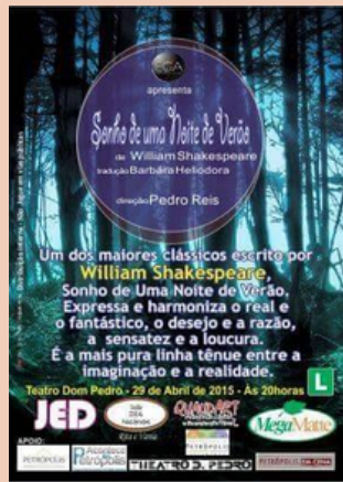
2015 Espetáculo Sonho de uma noite de verão Theatro Dom Pedro