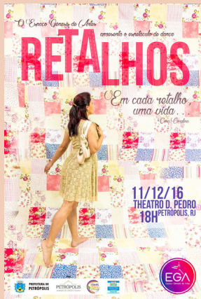
2016 Espetáculo de Dança Retalhos Theatro Dom Pedro