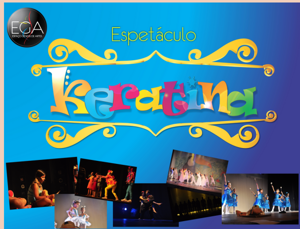
2010 Espetáculo de Dança Keratina Teatro Santa Cecília