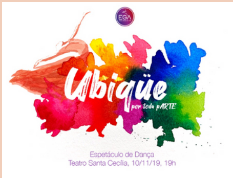
2019 Espetáculo de Dança Ubique Teatro Santa Cecília