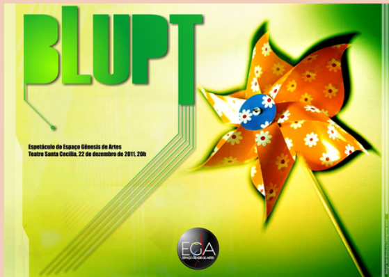
2011 Espetáculo de Dança Blupt Teatro Santa Cécilia