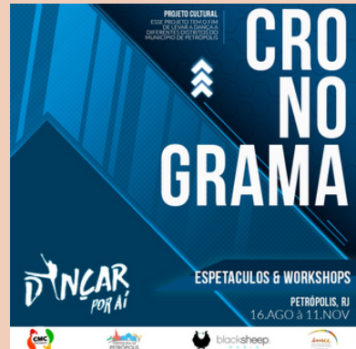
2019 Projeto Dançar por Aí