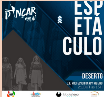
2019 Espetáculo de Dança Deserto Projeto Dançar por Aí