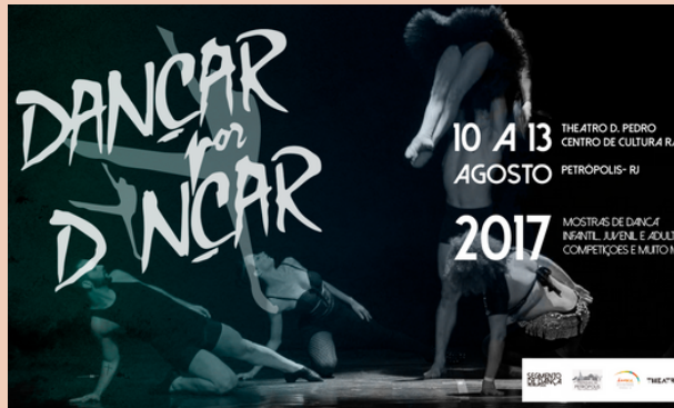
2017 Festival Dançar por Dançar