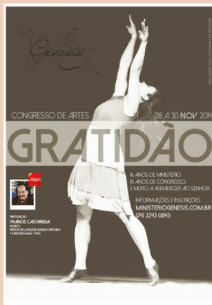
2014 Congresso de Artes Catedral Metodista