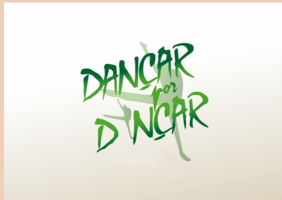
2018 Festival Dançar por Dançar