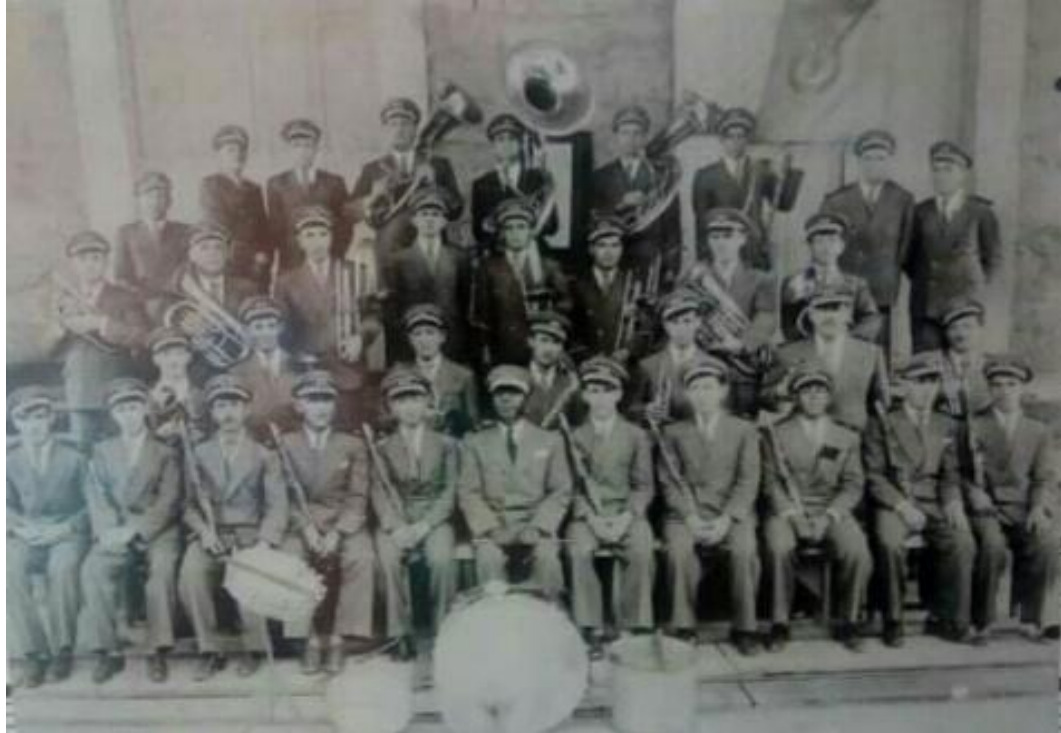
Banda 1º de Setembro 1941