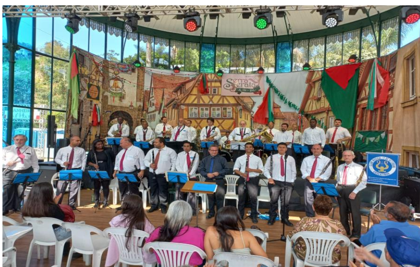
Banda 1º de Setembro Serra Serata 2022

Em sua formação completa, a Banda 1º de Setembro é formada por 32 músicos, podendo se apresentar com diferentes estilos musicais, do erudito ao popular, desde o renascimento ao contemporâneo.