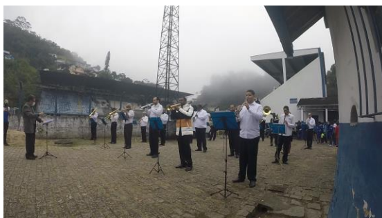
Retorno da Banda em 29/06/2021 Serrano F.C