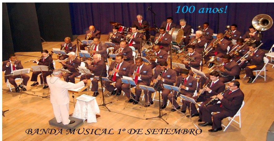
Foto Oficial do Centenário da Banda 1º de Setembro 1/9/2010