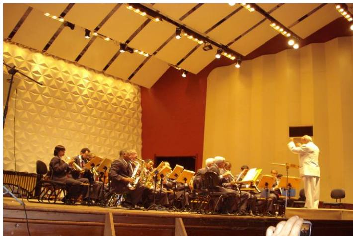
Maratona de Bandas 2009 Sala Cecília Meireles