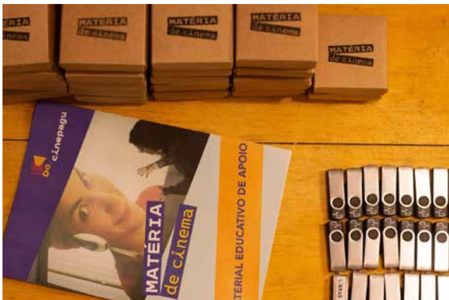
O projeto aconteceu entre fevereiro e março

O projeto distribuiu kits por 62 escolas estratégicas da rede municipal de ensino da cidade. Cada escola recebeu um kit contendo: 1 pendrive com o documentário e o curta completos + Material especial de apoio para realização de debates e atividades.