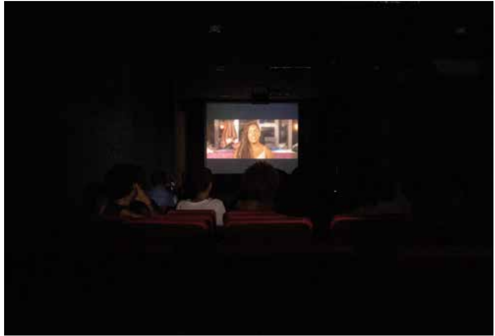
Cine Pagu e UNA LGBT - Sessão pela Visibilidade Lésbica - Agosto de 2022 - Teatro Afonso Arinos