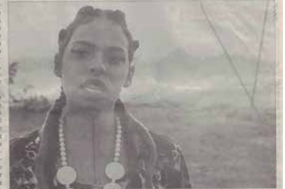
O documentário apresenta o dia a dia de três mulheres e a violência no gênero por toda nos espaços públicos.

O primeiro Cine debate Gênero & Política aconteceu no Dia Internacional do Cinema LGBTI, em dia 17 de maio, com o filme “Meu corpo é político”, que levantou questões sobre a realidade da população LGBTI a partir de práticas e situações cotidianas. A ideia dos organizadores é continuar pensando a cidade e seus desdobramentos nas questões de gênero, levantando a discussão sobre o modelo sexual. A iniciativa é um projeto de