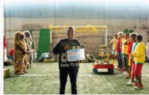
Documentário 'Matéria de Cinema' terá exclusiva sessão virtual no dia 14 de fevereiro