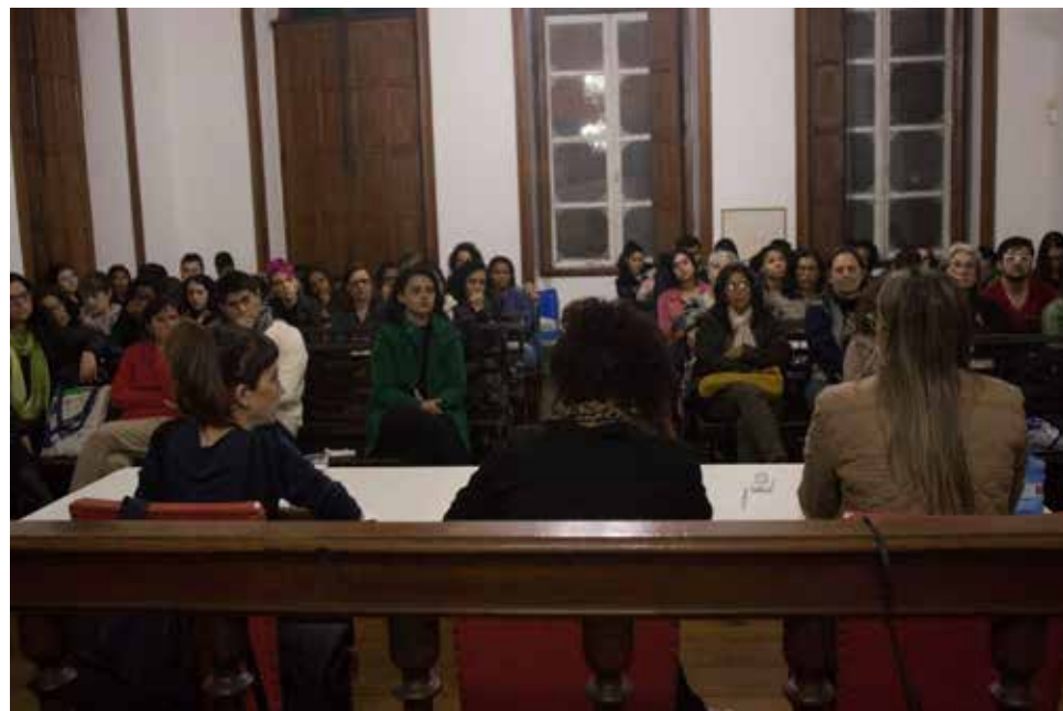
CEFET recebe Cine Pagu: Educação e Cidade: Acesso e Permanência - Setembro de 2019