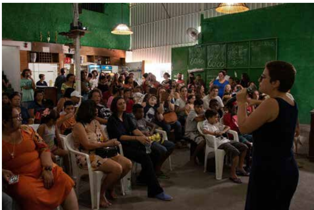
Cine Pagu na quadra do Independência - Fevereiro de 2020