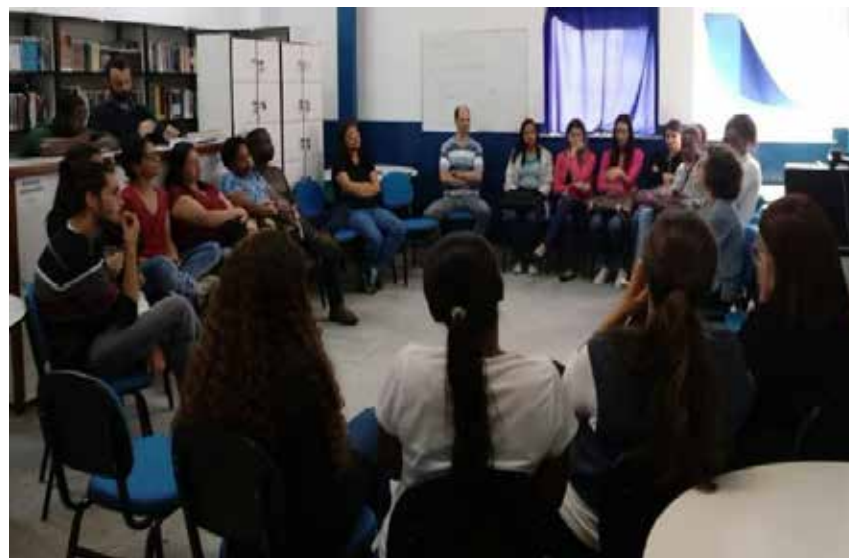
Cine Pagu na Semana de Ciência e Tecnologia FAETEC Petrópolis - Outubro de 2019