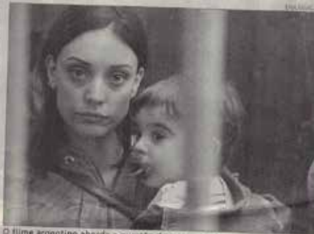
O filme argentino aborda a maternidade na prisão.

Dando continuidade a programação deste ano, desta vez, o longa escolhido aborda a maternidade no sistema prisional. No drama, uma mulher grávida é presa após a morte de um homem, tendo que lidar com sua condição em uma ala especial da prisão.