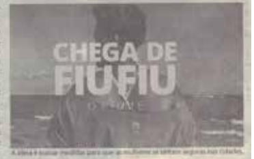
A ideia é trazer respostas para que as mulheres se sintam seguras nos espaços públicos.

O endereço é Rua Monsenhor Bacelar, nº 400, no Centro. Mais detalhes podem ser consultados pelo telefone (24) 2342-2462.