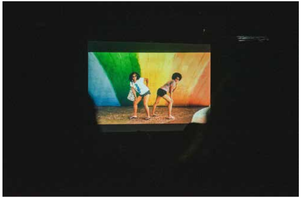
Cine Pagu e UNA LGBT - Sessão pela Visibilidade Lésbica - Agosto de 2022 - Teatro Afonso Arinos