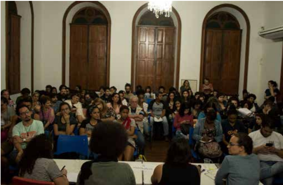
CEFET recebe Cine Pagu: Segregação, Ocupação e Patrimônio - Maio de 2019