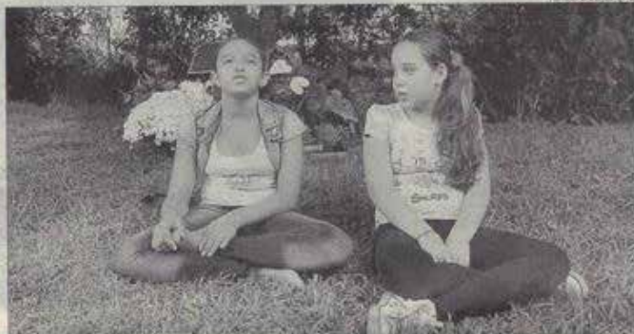
O documentário "Quando eu sinto que já sei" reúne depoimentos de alunos, pais e professores da rede pública.