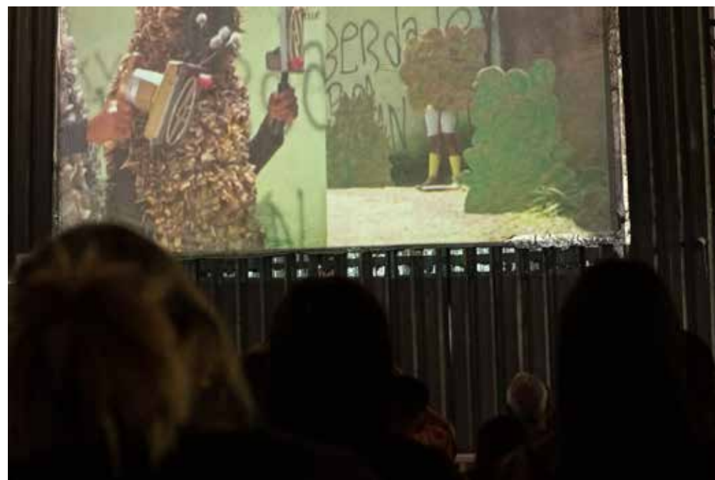
Cine Pagu na quadra do Independência - Fevereiro de 2020