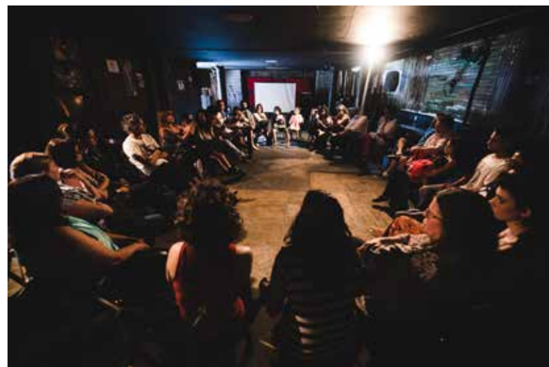
Cine Pagu no Aldeia - Novembro de 2018