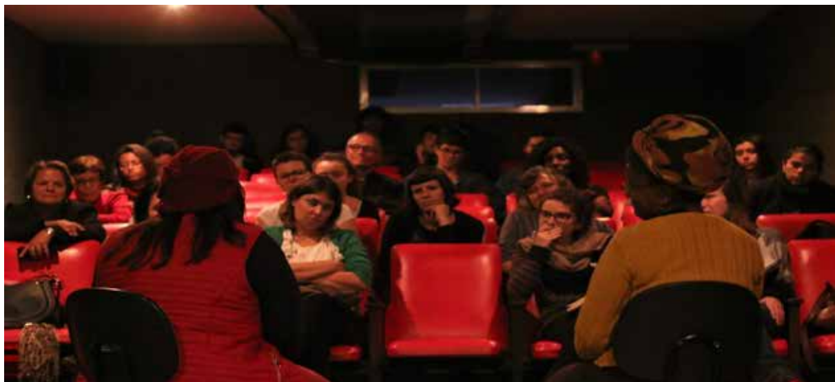
Cine Pagu "Libertem Angela Davis" - Agosto de 2017