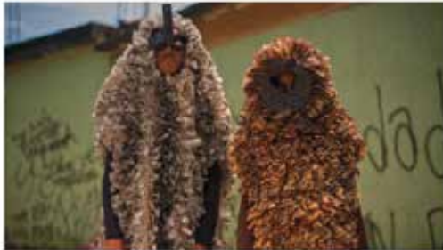
Matéria site Mundo Negro - Matéria de Cinema