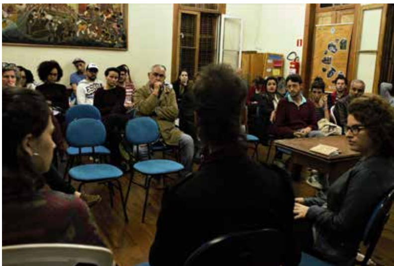
Cine Pagu debate Gênero e Política - Maio de 2018