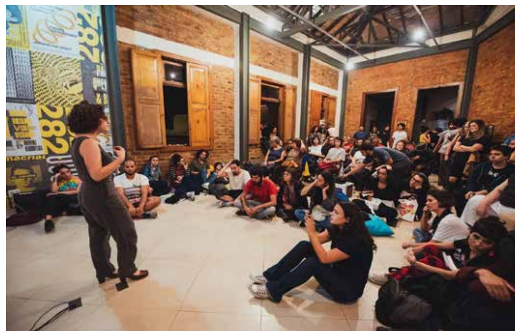
Cine Pagu debate Eleições "O Processo" - Outubro de 2018