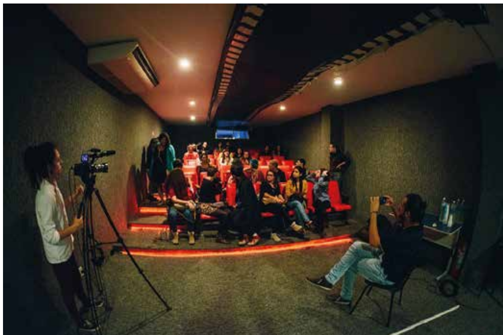
Cine Pagu + Cine 360° : "Armanda" - Novembro de 2017