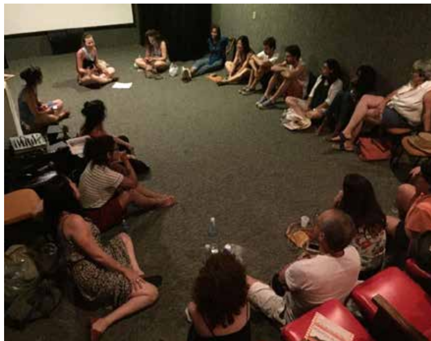
Cine Pagu "4 meses, 3 semanas e 2 dias" - Outubro de 2017