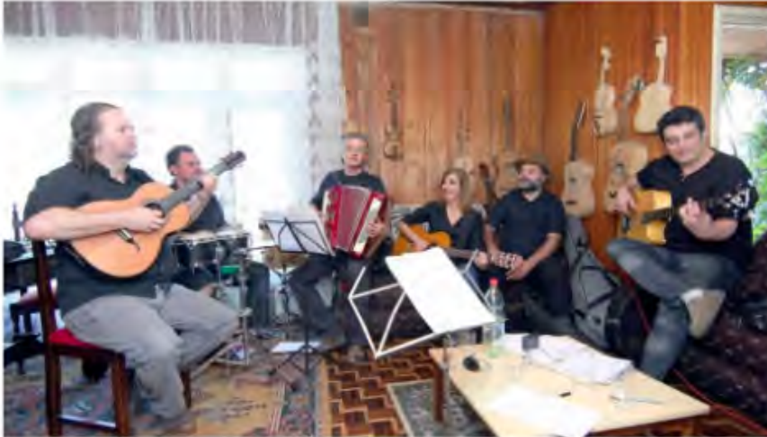
Grupo Viola Quebrada é um dos principais representantes da música de raiz | Foto: Valterci Santos/Gazeta do Povo

Por Luiz Claudio Oliveira | luizs@gazetadopovo.com.br | 04/10/2011 21:19