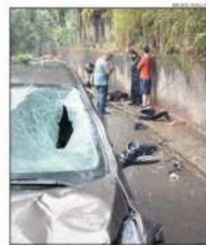
Um serviço da Secretaria Municipal de Saúde