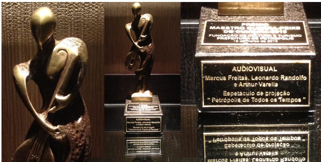
Prêmio Maestro Guerra Peixe de Cultura de 2014 com o espetáculo Petrópolis de Todos os Tempos