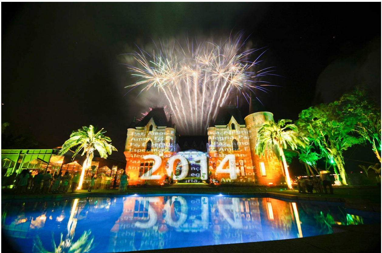
(Reveillon 2014 no Castelo de Itaipava)