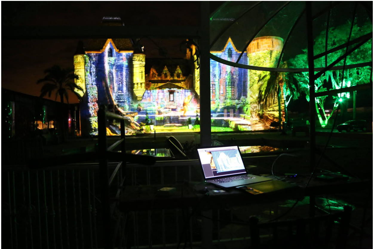
Reveillon 2015 no Castelo de Itaipava