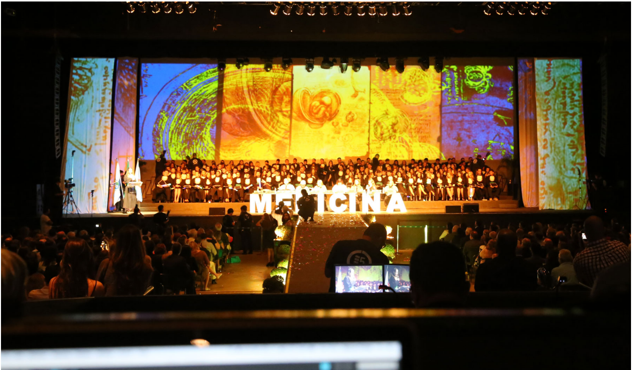
(Video Mapping em Palco e Coxias do CityBank Hall -Rio de Janeiro)