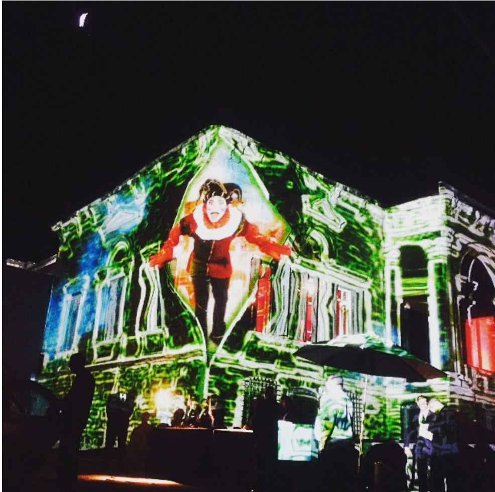
Video Mapping no Parque Lage - Rio de Janeiro